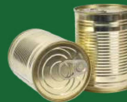
BARATTOLI E SCATOLE PER ALIMENTI