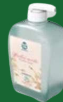
FLACONE SAPONE LIQUIDO