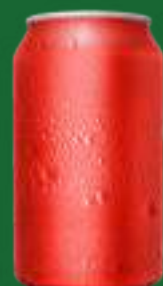
LATTINE DI BEVANDE