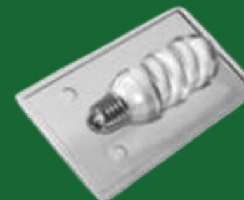
BLISTER TRASPARENTI PREFORMATI