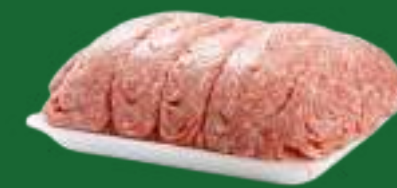
VASCHETTA IN POLISTIROLO