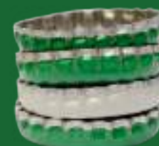
TAPPI E COPERCHI